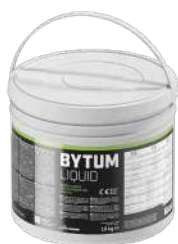
BYTUM LIQUID pag. 50