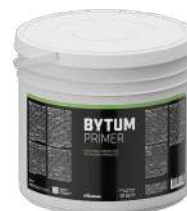
BYTUM PRIMER pag. 53